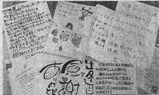
古着とともに回収袋の中に入っていた送り主からの手紙

古着などを専用の回収袋に入れて送るだけで、途上国で再利用されるだけでなく、子どもたちへのワクチン寄付といった社会貢献にもつながるサービス「古着deワクチン」。回収された古着はどのようなプロセスをたどるの? 本場に役立っているの? 朝日新聞Reライフプロジェクトの読者会議メンバーが回収センターを見学して、古着deワクチンの仕組みや意義について理解を深めました。(根本理香)