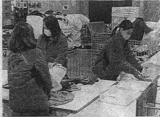
回収袋から取り出された古着類はベルトコンベヤーに載せられ、衣類と衣類以外の服飾品などに選別される=2月2日、千葉県木更津市の古着deワクチンセンター