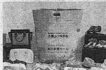
協業で製作したオリジナル回収袋(中央)

大切にしていた衣類や雑貨類といった思い出の品々や、クローゼットに眠って使わなくなった物を手放すことで誰かのお役に立ちたい。そんな思いをつなげて世界の誰かを笑顔にできる「古着deつながる支援キット」を、朝日新聞SHOPと日本リユースシステムの協業で商品